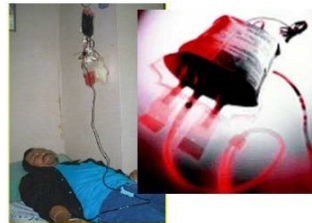
2) 輸血 transfusão sanguínea