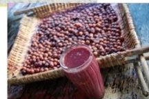
1) 媒介吸血昆虫 サシガメ Triatomina dimidiata